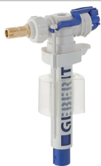
Imagen de ejemplo